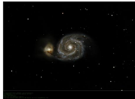
La galaxie du moulinet, Patrick M51, février 2026

Qui reconnaîtra les objets sur cette photo prise par Philippe en mars 2026 ?